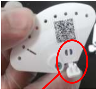
壓扣環 (圖 1)