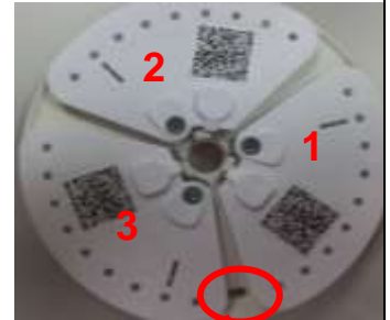
辨識孔 (圖 4)