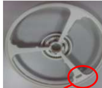
辨識孔 (圖 3)